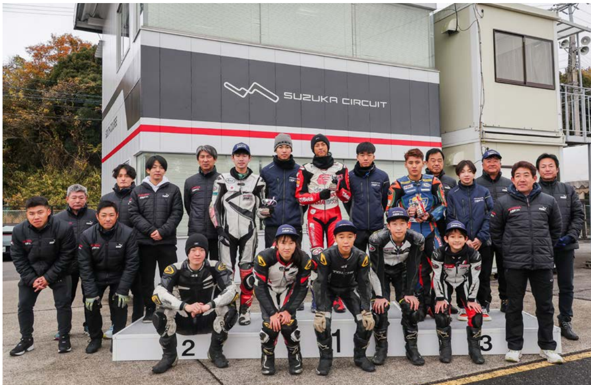
ともに学び、ともに成長したライバルたち、Principal、Instructorの皆さんとともに (HRS鈴鹿Kart Class:上/HRS鈴鹿Moto Class:下)