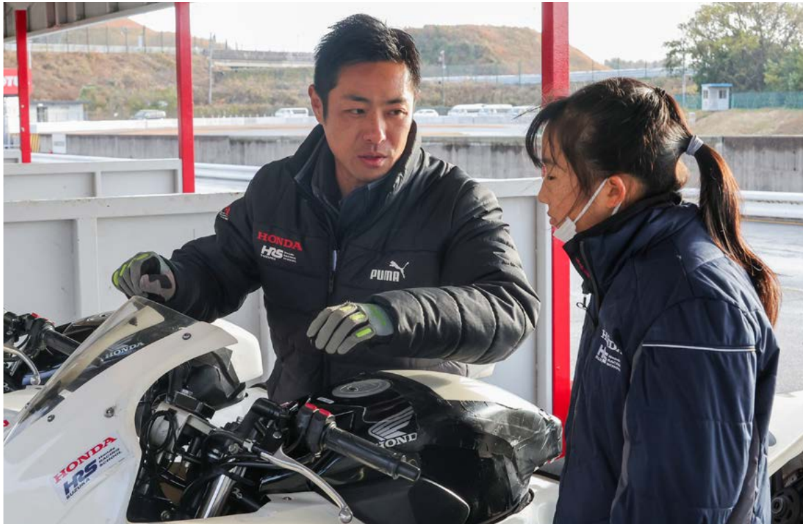
重要なルーティンワークとしての走行前後のメンテナンスと同時に、Instructorとのコミュニケーションも有意義 (HRS鈴鹿Moto Class)