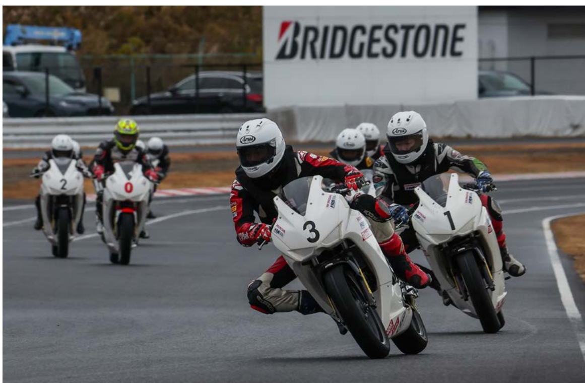
HRS鈴鹿Moto Class修了記念走行シーン