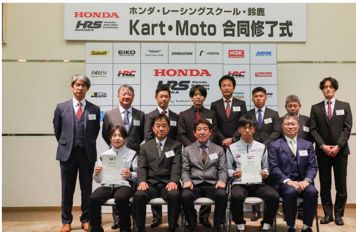
HRS鈴鹿Moto Class修了式集合写真 (HRS鈴鹿Moto Classベーシックコース:上、HRS鈴鹿Moto Classアドバンスコース:下)