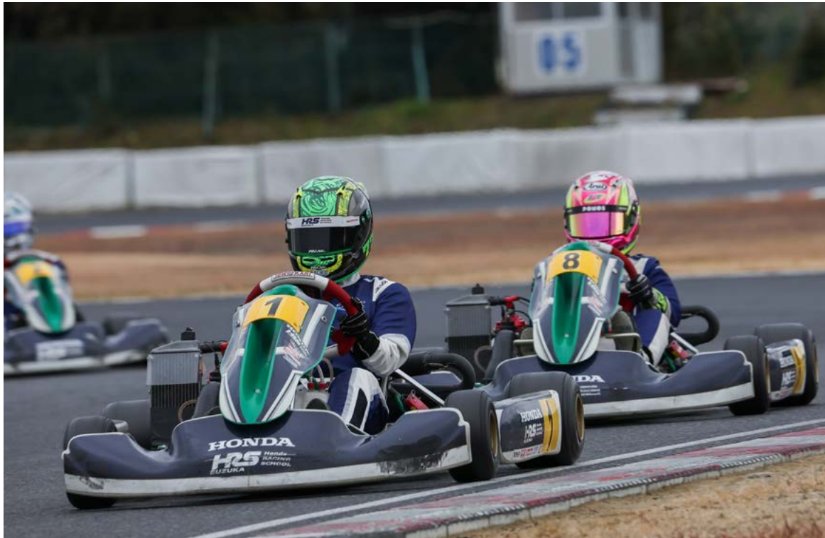
HRS鈴鹿Kart Class修了記念走行シーン