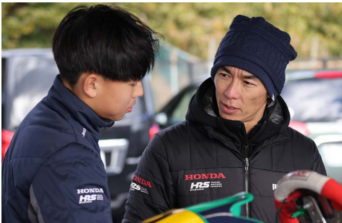
世界のトップカテゴリーでの経験を伝えるPrincipal。極めて貴重な機会を見逃すことはできない (HRS鈴鹿Kart Class)