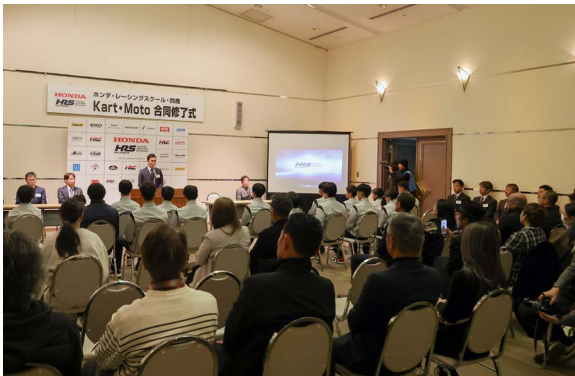
Moto Class・Kart Classの受講生19名が晴れやかな表情で成長した姿を披露した

このように「HRS鈴鹿」は今後も随時カリキュラムの充実を図っていきます。今後もHRS鈴鹿の活動、そしてHRS鈴鹿の卒業生たちの活躍にご注目願います。